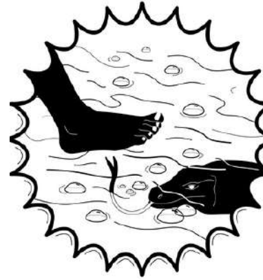
Logo Monitor Lizard House

เพื่อเป็นการตอบโต้ต่อชิ้นงานของ โทมัส ซาราเซโน ผู้คิดค้น Aerocene นั้น ทางมอนิเตอร์ ลิซาร์ด เฮาส์ จะคิดค้นวิธีการจับสัญญาณและสร้างให้เห็นภาพวิฤตด้านภูมิอากาศที่กำลังกัดกร่อนพื้นที่ชายหาดทางตอนใต้ของกรุงเทพมหานคร - สมุทรปราการ