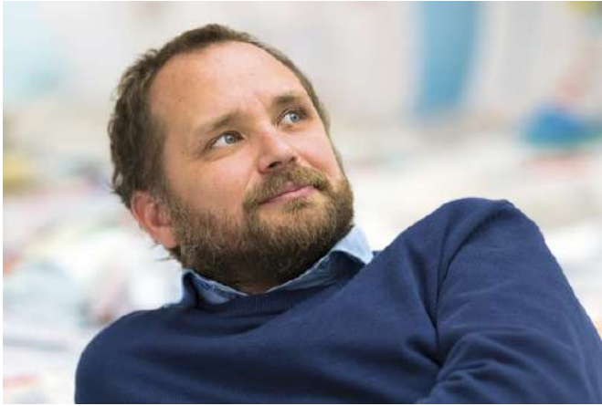
Tomás Saraceno.

การสร้างสรรคงานศิลปะของ โทมัส ซาราเซโน มีต้นแนวคิดมาจากเรื่องราวการเชื่อมศิลปะ วิทยาศาสตร์ชีวิตและสังคมศาสตร์เข้าด้วยกัน ในความพิวพันของจุดเชื่อมโยงต่างๆ ในโลกต่างๆ นี้ ส่งผลต่องานประติมากรรมลอยตัว โปรเจกต์ด้านชุมชน รวมถึงการจัดวางอันสร้างความรู้สึกร่วมของเขานำเสนอความสมานฉันท์ด้านความรู้สึกร่วมของโลกใบนี้ผ่านนิเวศแห่งการปฏิบัติด้านสังคม ด้านจิตใจและสิ่งแวดล้อม