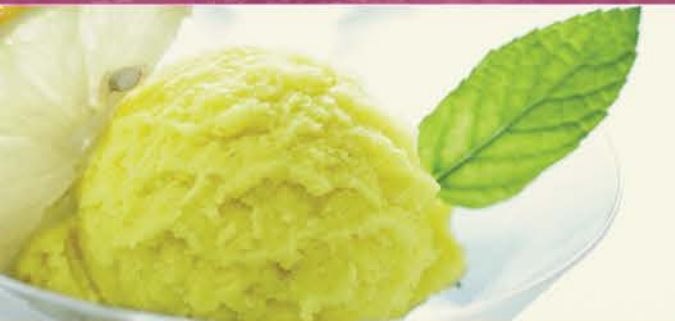
Colonel 7.00 Sorbet Citron Arrose De Vodka