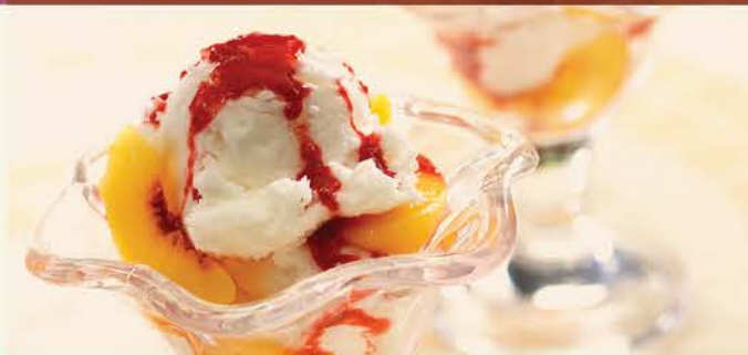
Péché Melba 6.00 Crème Glacée Vanille, Péché Sirop, Sauce Groseille Et Chantilly