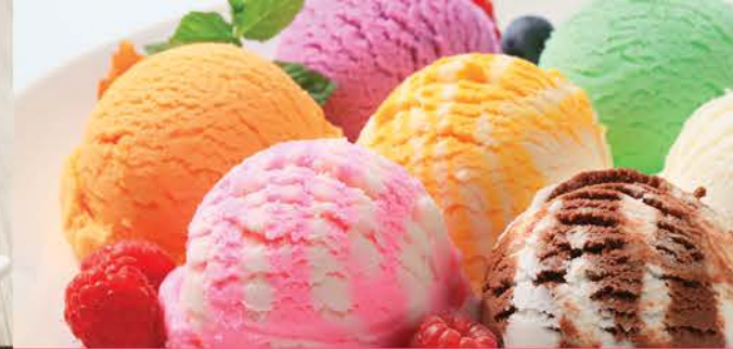
Coupe Parma 6.00 Salade De Fruits, Fraise, Vanille, Chocolat