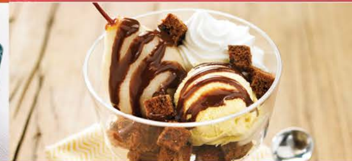
Poire Belle Hélène 6.00 Crème Glacée Vanille, Poire Fruit, Sauce Chocolat Et Chantilly