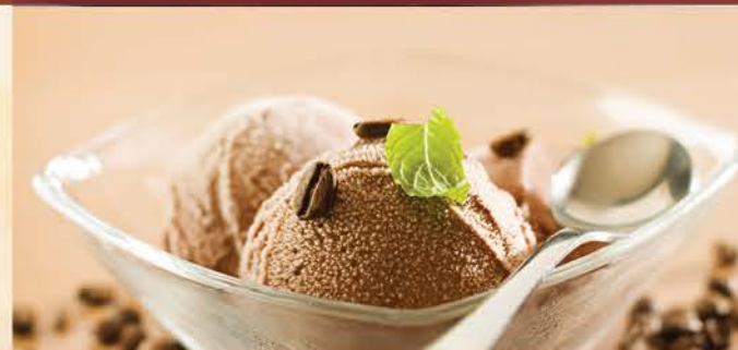
Coupe Italienne 6.00 Straciatella, Cappuccino, Tiramisu