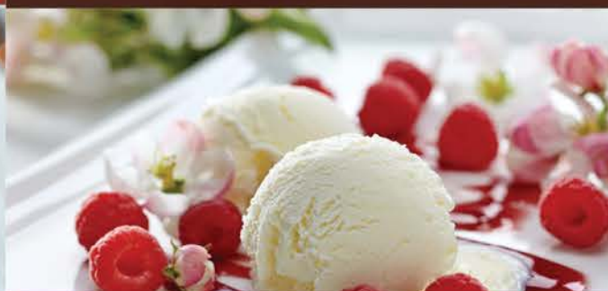
Amarena 6.00 Crème Glacées Vanille, Marbrée De Coulis Et De Cerises Amarena, Décor Griottes

NOS PÂTISSERIES Tarte Aux Pommes Ou Bananes Chaudes 7.00 Tarte Au Citron Meringuée 5.00 Tiramisu Maison 6.00 Fruit Givrés Au Choix 5.00 Citron Ou Orange, Ou Mangue Ou Noix De Coco