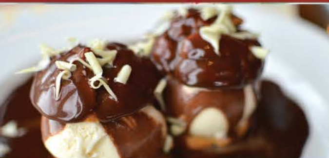
Profiteroles 7.00 Choux Garnis De Crème Glacée A La Gousse De Vanille, Décores Par Des Grêlons De Sucre