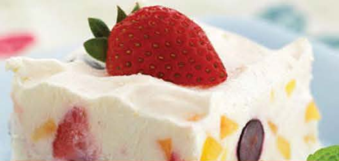
Mystérieux 6.00 Crème Glacée Vanille, Meringue, Enrobée De Nougatine