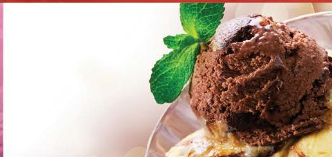
Café, Chocolat Liégeois 6.00 Crème Glacée Café Ou Chocolat, Sauce Café Ou Chocolat, Chantilly

NOS PLAISIRS Salade De Fruit Maison 5.00 Crème Caramel Maison 5.00 Mousse Au Chocolat Maison 5.00 Crème Brûlée Maison 5.00