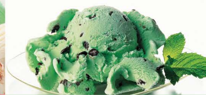
Peppermint 6.00 Crème Glacées Menthe, Chocolat Arrosées De Peppermint