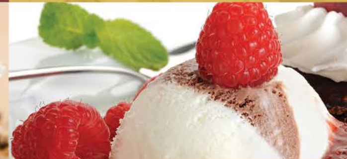
Fraise Melba 7.00 Crème Glace Vanille, Fraises Fruits Et Chantilly