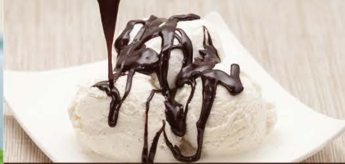
Dame Blanche 6.00 Crème Glacée Vanille Et Sauce Chocolat Chaud