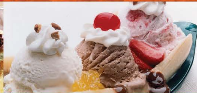
Banana Split 7.00 Crème Glacées Vanille, Chocolat, Fraise, Banane Fruit, Chantilly Et Sauce Chocolat