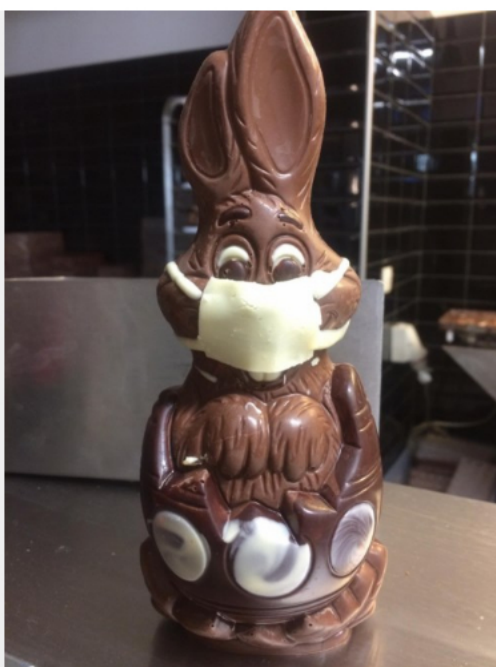
Le Lapinou solidaire de Cocotree pour aider le personnel hospitalier. Cocotree