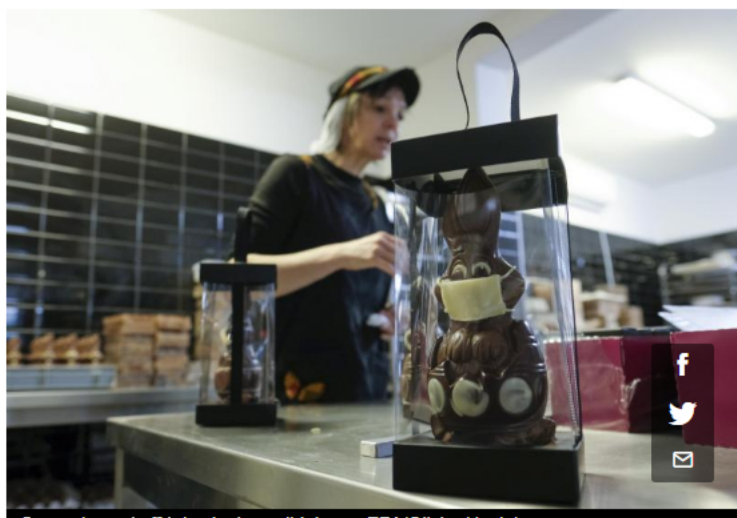
On peut aussi offrir les lapins solidaires.