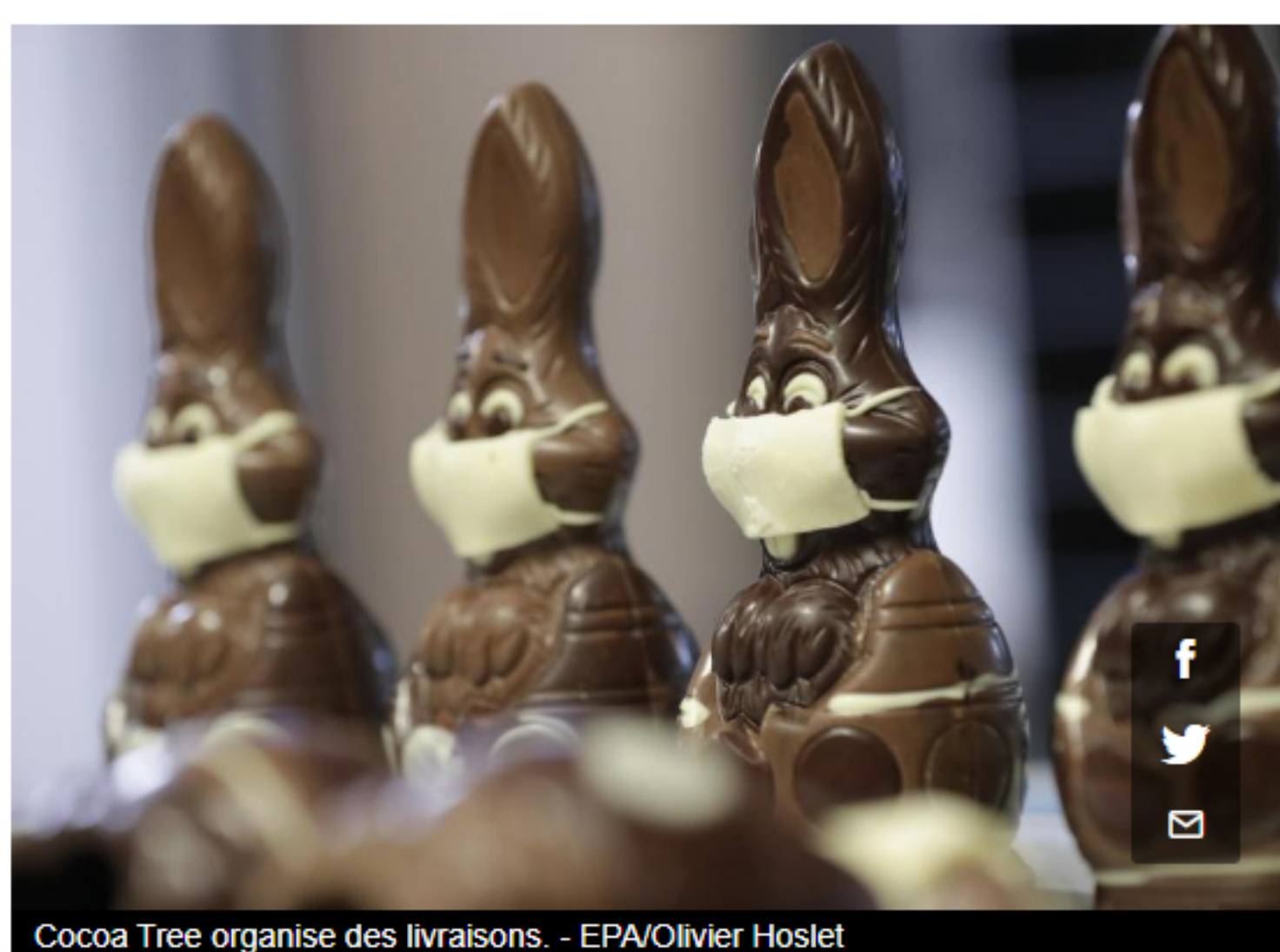
Cocoa Tree organise des livraisons.