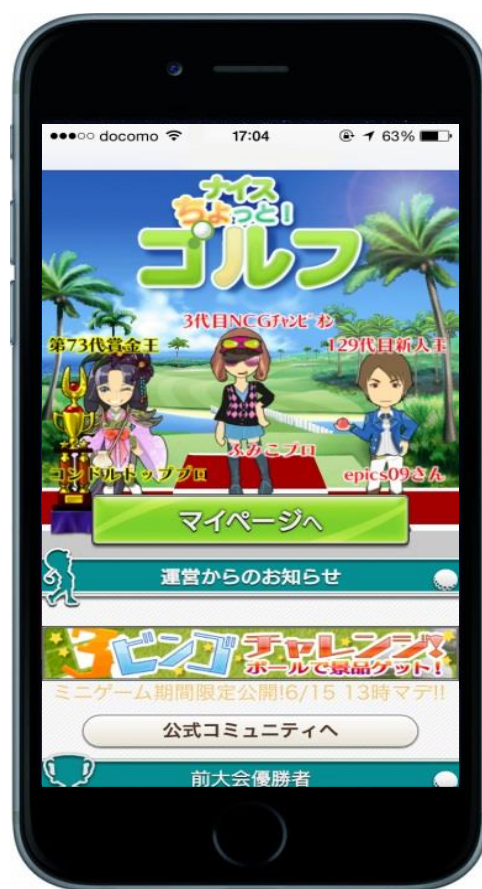
ナイスちょっと！ゴルフ