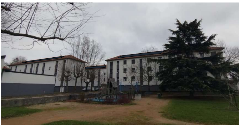
Représentation des installations solaire PV sur toiture – Résidence du Pallordet, rue des peupliers à Bourg en Bresse