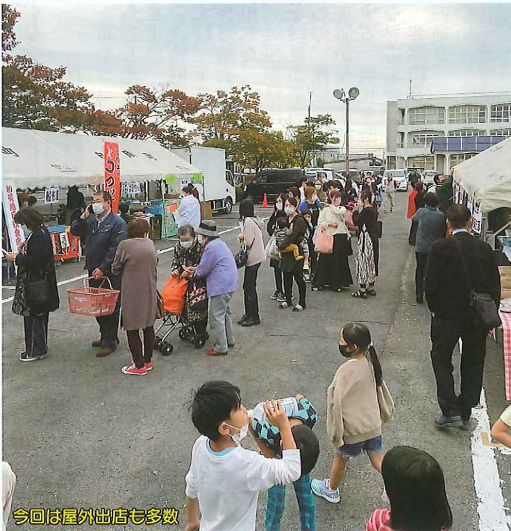
今回は屋外出店も多数

画」として、かつぱ夕市を5月22日より6月26日までの毎週金曜日16時〜18時30分の時間帯での全6回、各店自慢の料理をテイクアウト販売いたしました。その際に回収しましたアンケートには「継続してやってください」との多数の要望を受け、10月16日(金)に、かつぱ笑会の店内の10事業所のテイクアウト商品に加え、新たに設置した屋外テントでは11事業所が出