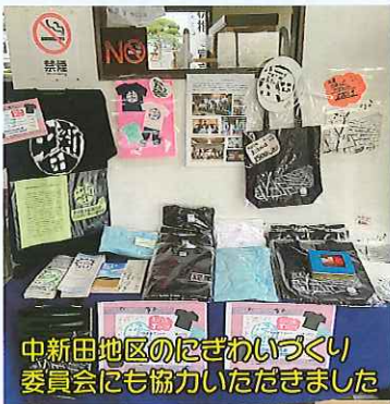
中新田地区のぼぎわいづくり委員会にも協力いただきました