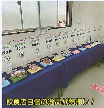
飲食店自慢の逸品が勢揃い!

来たて熟々の商品や採れたての農産物等を販売、多くの来場者で賑わいました。もちろんかつぱ夕市を開催するにあたり、スタッフはもちろんご来場者の検温、マスク着用、アルコール消毒のほか、徹底した商品管理と引換券による販売の導入等、十分な感染防止対策を行いました。次回は11月13日(金)の開催を予定しておりますので是非おいでくださいませ。