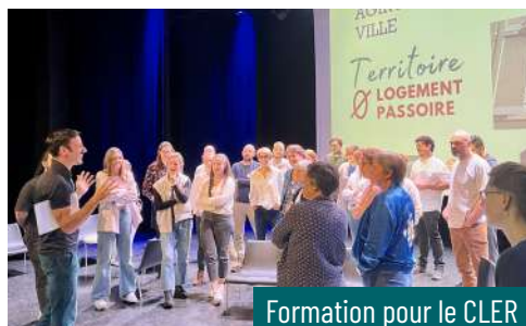
Formation pour le CLER

participant-es étaient chargé-es de programme SLIME. L'échange a confirmé les limites profondes du modèle actuel : une approche individualisante, et un positionnement « neutre » entre locataires et propriétaires, qui reproduit les rapports de domination au lieu de les corriger. Cette rencontre a permis de remettre sur la table, au sein même du CLER, l'enjeu de refondation du dispositif à partir d'un prisme de justice sociale, de pouvoir d'agir des locataires, et d'efficacité concrète pour la rénovation le parc locatif privé.