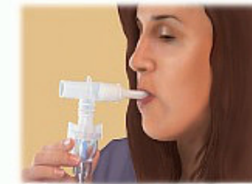
4. Ponga la boquilla en su boca o las mascarilla facial cubriendo nariz y boca. Respire a través de su boca hasta que el medicamento se haya consumido