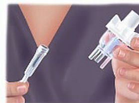
3. Adjunte el vaso nebulizador al tubo que va en el compresor