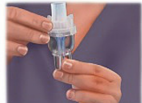
2. Adjunte la boquilla o máscara al vaso nebulizador