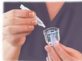
1. Coloque el medicamento dentro del vaso nebulizador