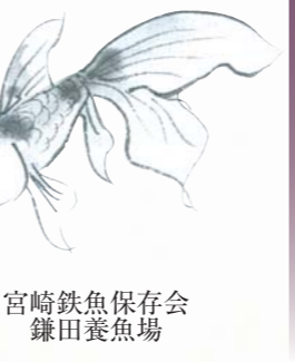
宮崎鉄魚保存会 鎌田養魚場