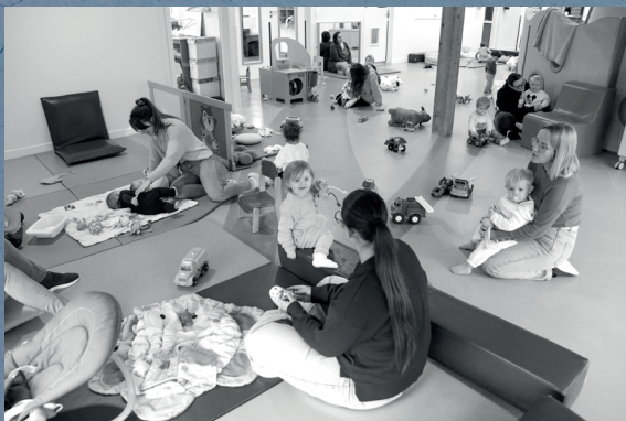
Deux crèches : "Les trois Petits Pas" et "Haut Comme Trois Pommes" !

Une équipe dynamique pour accueillir vos enfants de manière régulière ou occasionnelle !