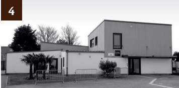
4 CRÈCHE "LES TROIS PETITS PAS"