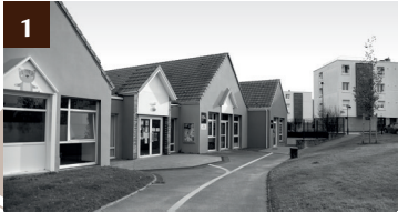
1 MAISON DE QUARTIER MARLBOROUGH CRÈCHE "HAUT COMME TROIS POMMES"