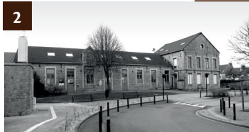
2 MAISON DE QUARTIER CENTRE