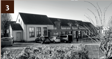
3 MAISON DE QUARTIER OSTROHOVE