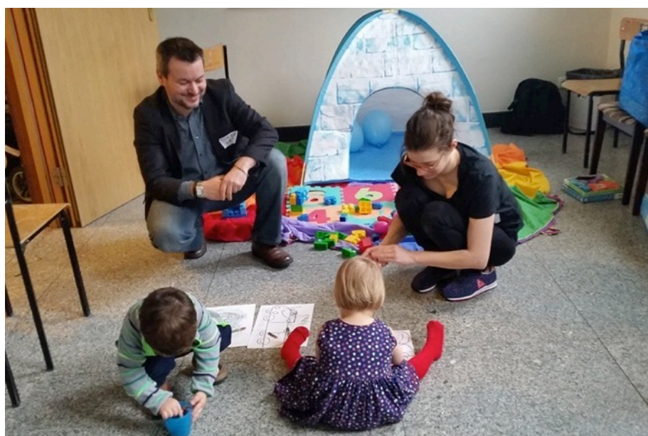
Kącik dla dzieci