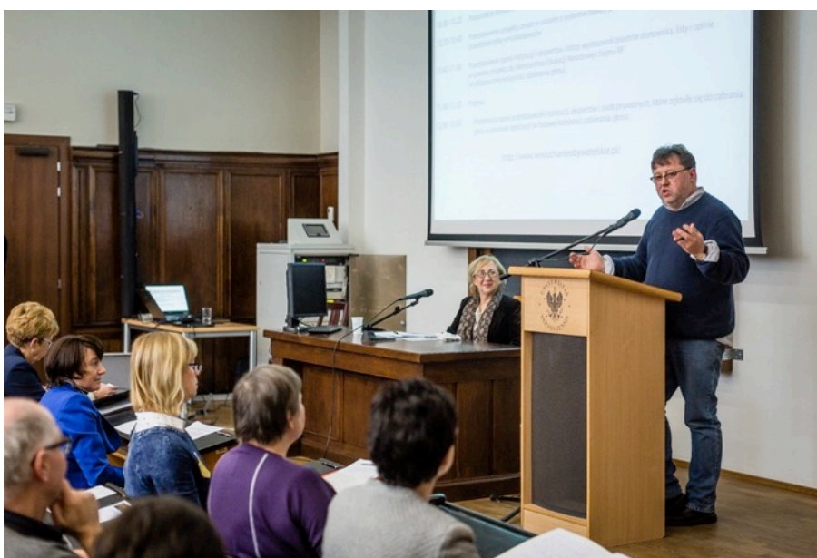
Wstęp do wysłuchania przygotowany przez Kubę Wygnańskiego