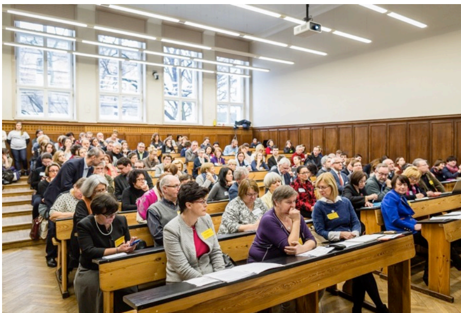
Wysłuchanie w Auditorium Maximum, sala C