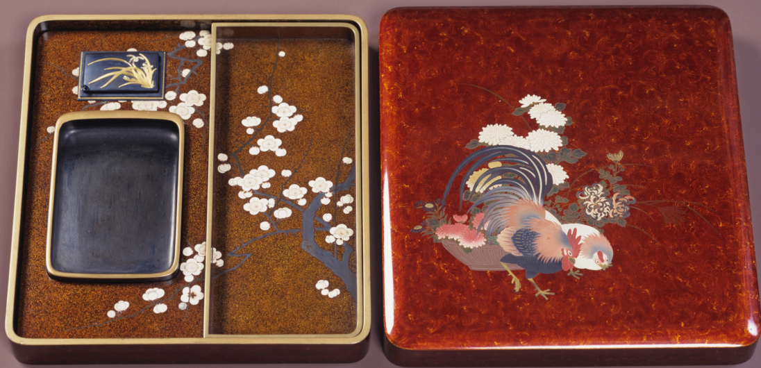
八代 小原治五右衛門《鶏に花籠蒔絵硯箱》 縦24.8 × 横23.2 × 高4.0 cm 南砺市指定文化財

永きにわたり特異な光彩を放ち、安土桃山時代より一子相伝で受け継がれてきた 城端蒔絵・小原治五右衛門の450年記念展を開催します。