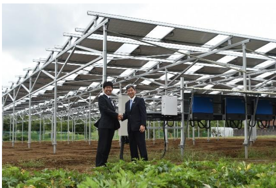
営農型太陽光設備前での記念撮影

営農型太陽光発電（ソーラーシェアリング）事業は、一つの土地で農業と発電事業を同時に行なう取り組みで、新しい農業の形態として急激に普及が進んでいます。本事業では清水建設が発電事業を行い、つなぐファーム（千葉エコが設立した農業法人）が農業を担い、千葉エコが発電設備の管理運営を行うことで「アグリマネジメント」サービスを提供します。発電した電気は、清水建設グループによる小売電気事業を通じて需要家に供給を行いながら、地域密着型のビジネスモデルを模索していきます。